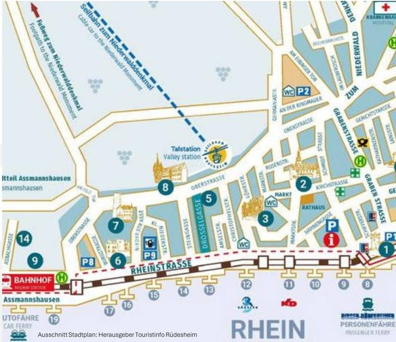
Ausschnitt Stadtplan: Herausgeber Touristinfo Rudesheim